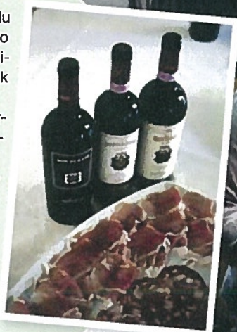
GODE PÅ MAT: Vin og spekemat er typisk fingermat over store deler av Italia, men særlig i Toscana.

Den lokale trattoriaen, uansett hvor du er, blir aldri feil. I området rundt Borgo di Vagli er det flere byer med gode spisesteder. Ett av de bedre ligger faktisk på landet, på vingården Avignonesi ( www.avignonesi.it ). Le Capezzine serverer fenomenale femretters lunsjmåltider – selvsagt med ypperlig vin til. Osteria le Logge i Siena ( www.gianni-brunelli.it ) holder høy klasse og har vunnet flere priser for sitt kjøkken. I Cortona bør du sjekke ut Osteria del Teatro ( www.osteria-del-teatro.it ), som har klassiske, toskanske retter på menyen, med råvarer fra gårdene rundt.