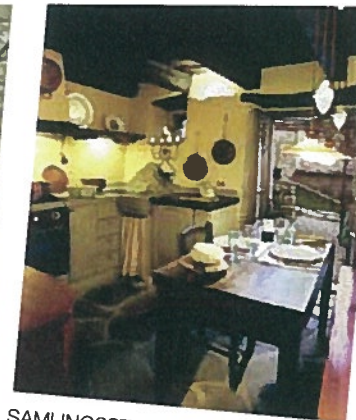
SAMLINGSSTED: De rustikke omgivelsene i Borgo di Vagli er utmerkede for å samle familie og venner, noe stedet også tilrettelegger for.