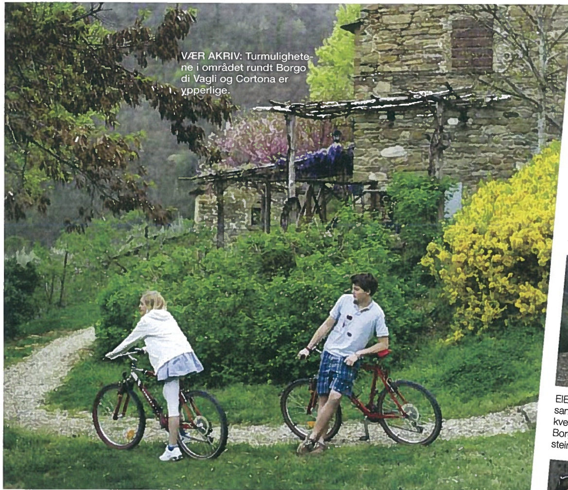
VÆR AKRIV: Turmulighetene i området rundt Borgo di Vagli og Cortona er ypperlige.