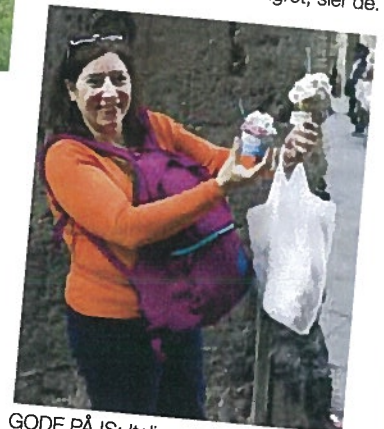
GODE PÅ IS: Italienerne elsker sin gelato, og i Toscana hevdes det hardnakket at iskremen ble skapt nettopp her.