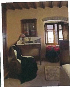
BORGO DI VAGLI