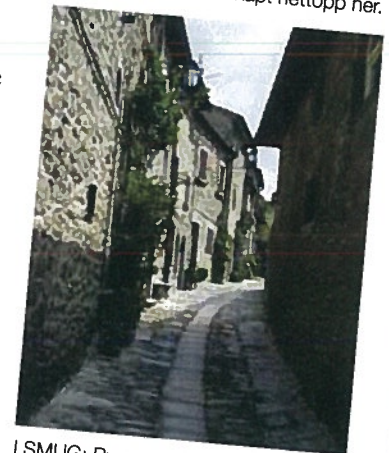
I SMUG: Byene i Toscana preges ofte av sine små smug, som dette karakteristiske bratte i Cortona.

H vilken livsglede! Under en rødmande vintersol tar grusveien oss forbi vingårder og markene som omkranser dem. Rundt oss synger fuglene ivrig forventningsfulle. Ellers er det behagelig stille.