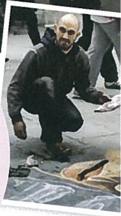
GATEKUNST: Sienas mange gateartister holder ofte et høyt kunstnerisk nivå, og reproducerer kjente kunstverk.