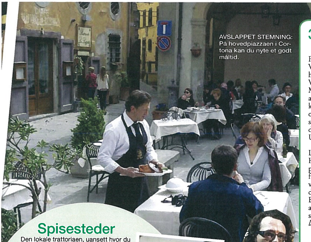
AVSLAPPET STEMNING: På hovedpiazzaen i Cortona kan du nyte et godt måltid.